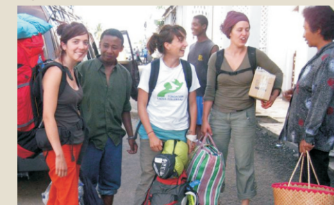
L'arrivée des 3 « monos » de la colo 2011